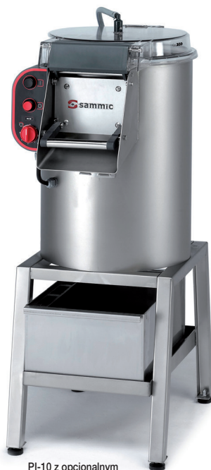
PI-10 z opcjonalnym separatorem obierzyn i podstawą