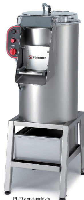
PI-20 z opcjonalnym separatorem obierzyn i podstawą