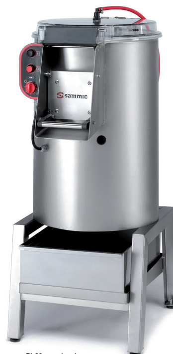
PI-30 z opcjonalnym separatorem obierzyn i podstawą